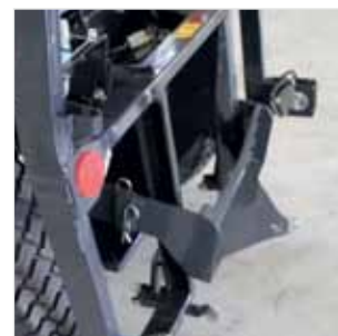
Crochet d'attelage SXG3-ATT