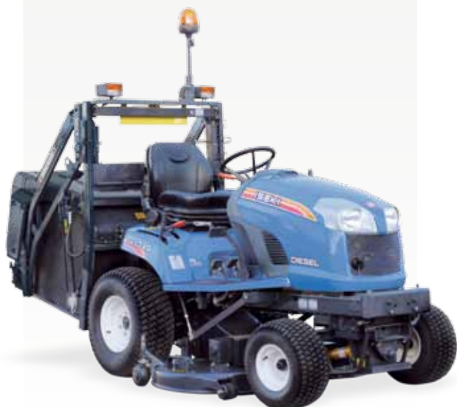
*machine présentée sans arceau - photo non contractuelle

En bref, acheter une autoportée ISEKI, c'est l'assurance d'un investissement que vous rentabiliserez toute l'année.