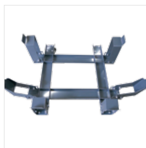
Chariot de dépose du bac SXG3-CHAR

*machine présentée sans arceau photo non contractuelle