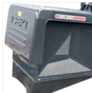
Fond de bac amovible KITDEFLSXG ou KITDEFLSXG600H