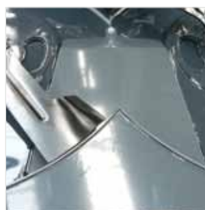
Kit mulching SXG3-KITMUL122 ou SXG3-KITMUL137