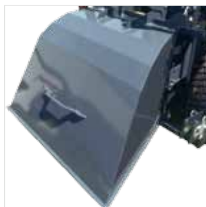
Déflecteur arrière SXG3-DEFL-