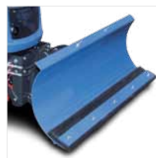
Lame à neige 1,25 m TLAN125/SXG