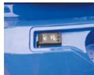
BENNAGE ÉLECTRIQUE (selon modèle)

DIRECTION SOUPLE ET ROBUSTE Système d'une très grande souplesse.