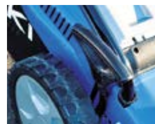
RÉGLAGE CENTRALISÉ DE LA HAUTEUR DE COUPE