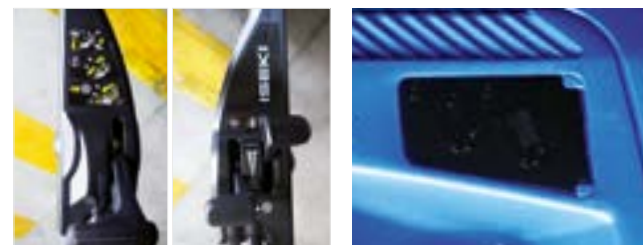
Commandes d'avancement et d'embrayage frein de lame (SWE5211VSB4)