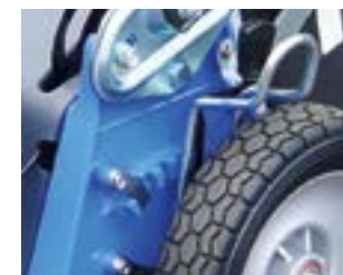
Réglage hauteur de coupe par essieu totalement protégé