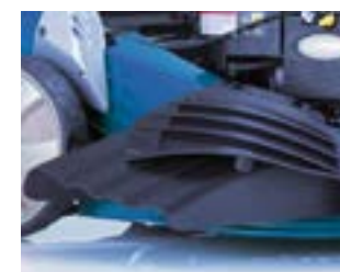
CHANGEMENT DE MODE RAPIDE Passez de l'éjection latérale à l'éjection arrière sans outils