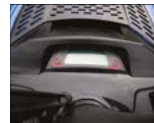
TABLEAU DE BORD COMPLET (selon modèle)