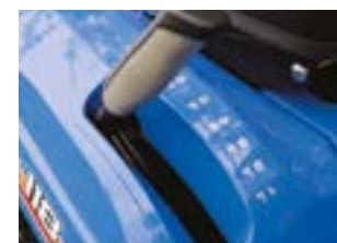
RÉGLAGE DE LA HAUTEUR DE COUPE CENTRALISÉ assisté par ressort