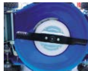
Carter de coupe alu avec renforts en acier