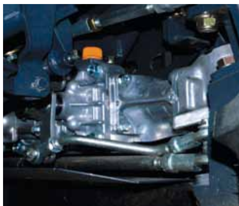
Moteur avec répartiteur d'huile pour limiter l'angle de braquage (SRA950F)