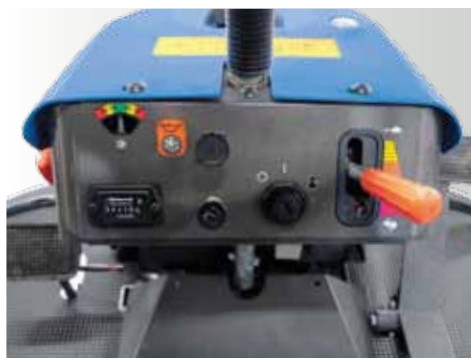
Tableau de bord très lisible avec compteur horaire, phares à leds, témoin du niveau d'huile, mode éco et indicateur de dévers.