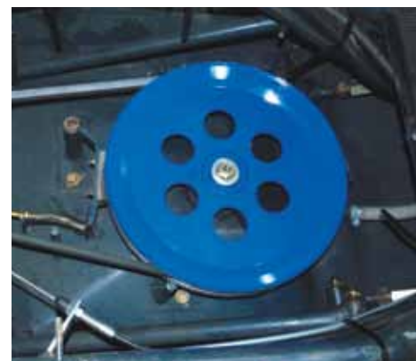
Transmission de lame par courroie avec poulie à ailettes