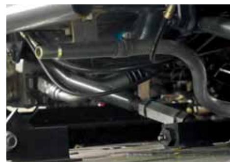
Branchement tuyau pour nettoyage du plateau