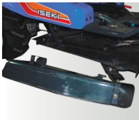
Carter latéral blocable en position relevée et démontable facilement.