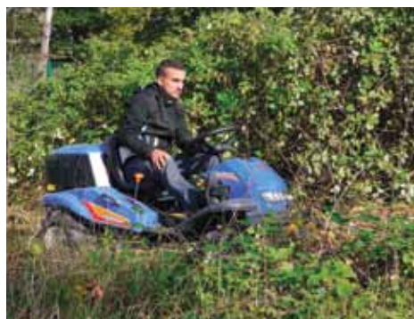
Idéale pour un travail en végétation dense.